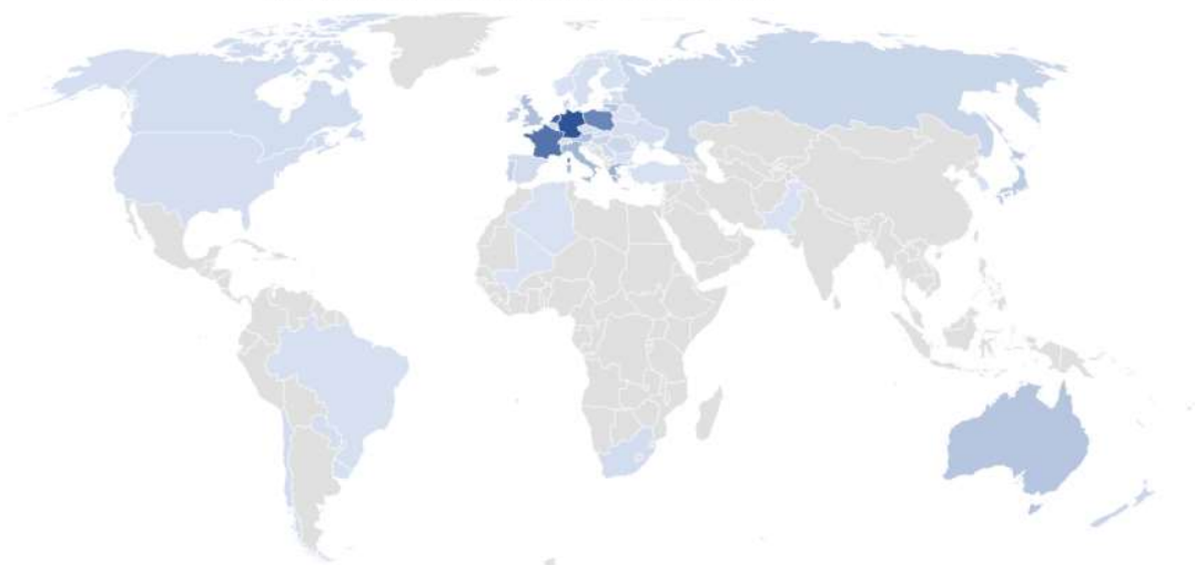
Ενοποιημένες πωλήσεις Βιομηχανίας ανά χώρα