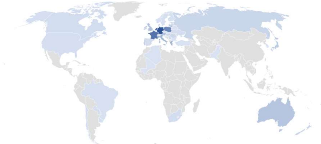
Ενοποιημένες πωλήσεις Βιομηχανίας ανά χώρα